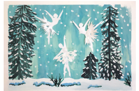
Коллективная работа объединения «Бумажные фантазии»