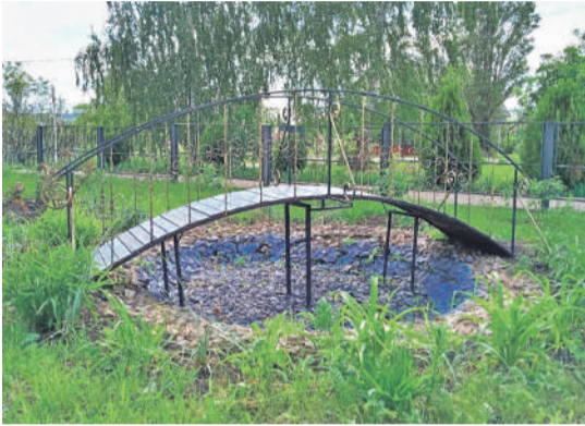
Уразовская школа № 2 Валуйского городского округа