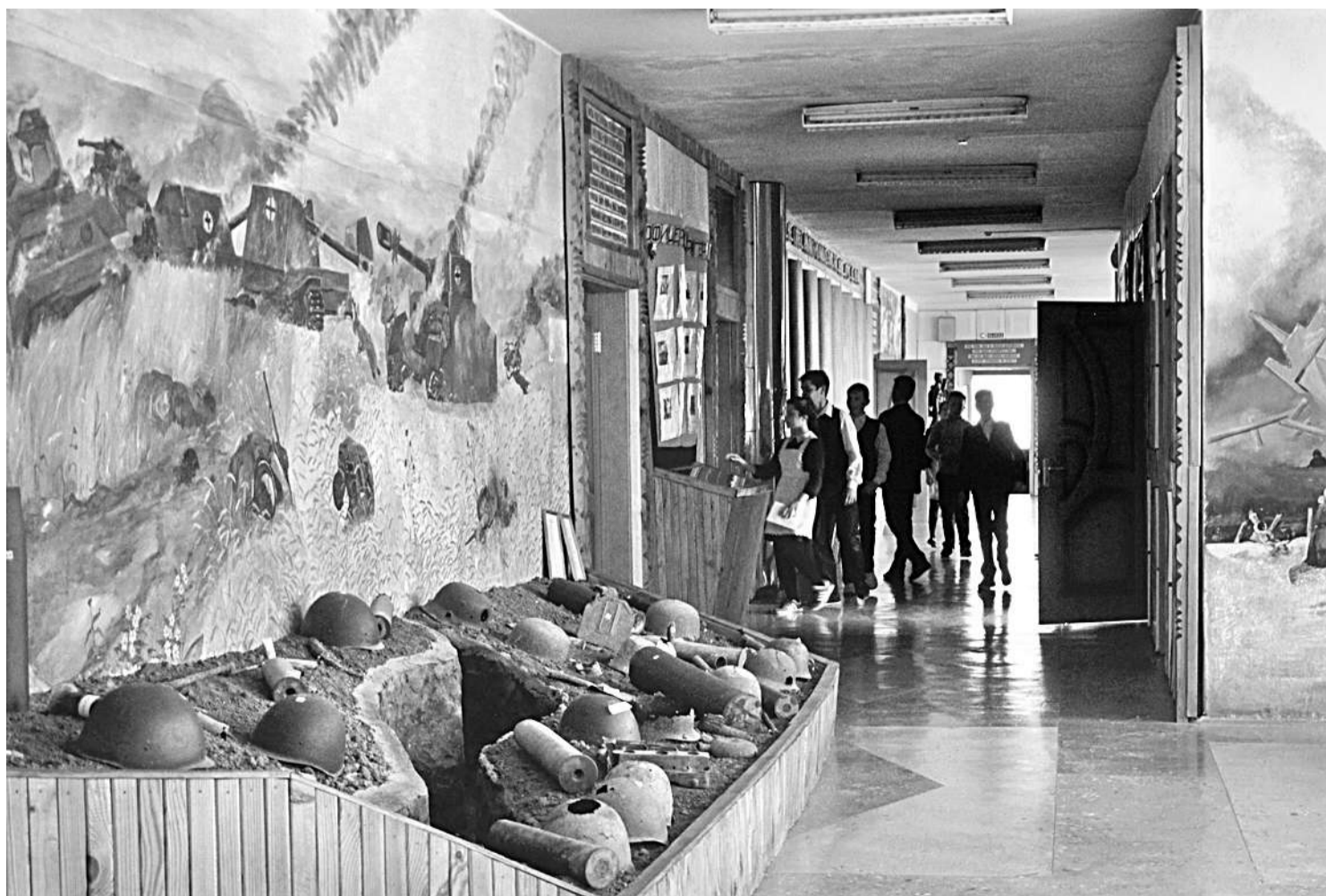
Школьный музей Великой Отечественной войны