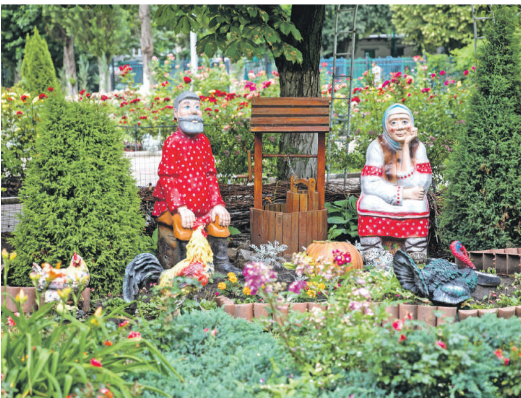
Школа № 41 г. Белгорода