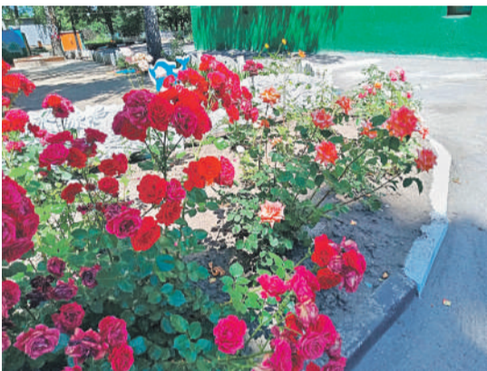
Детсад № 48 «Вишенка» г. Белгорода