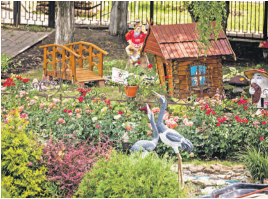
Школа № 41 г. Белгорода